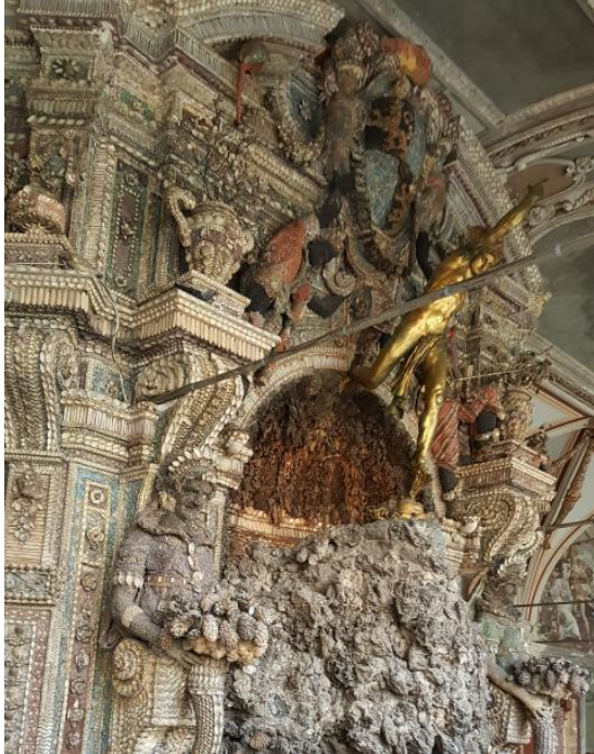
Ausschnitt aus dem Muschelbrunnen in der Grottenhalle

Der Kreisverband der Seniorenunion der CSU besuchte nach einer Führung durch die Residenz München die Fernsehstudios des Bayerischen Rundfunks in Freimann und war im Aufnahmestudio bei der Sendung der Abendschau live dabei.