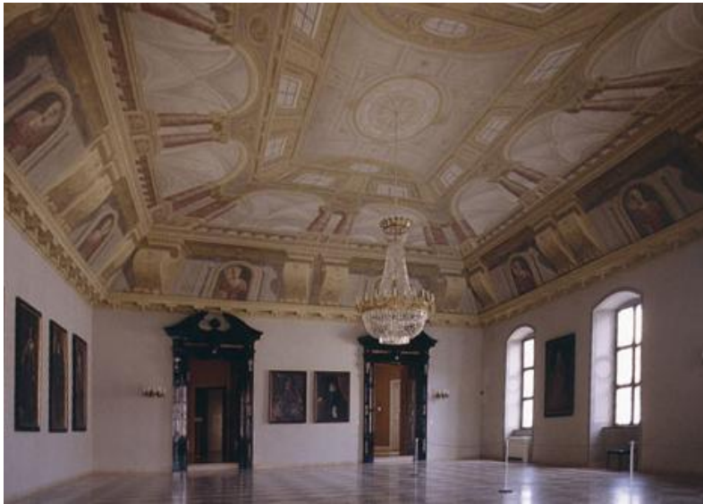
Der schwarze Saal

Der schwarze Saal, nach den auffälligen schwarzen Türen so genannt, ist eine Art Vorhalle zu den Kurfürstenzimmern. Bemerkenswert ist die Deckenmalerei, die trotz flacher Wand die Illusion von Säulen, Kapitellen und Stuckarbeiten hervorzaubert.