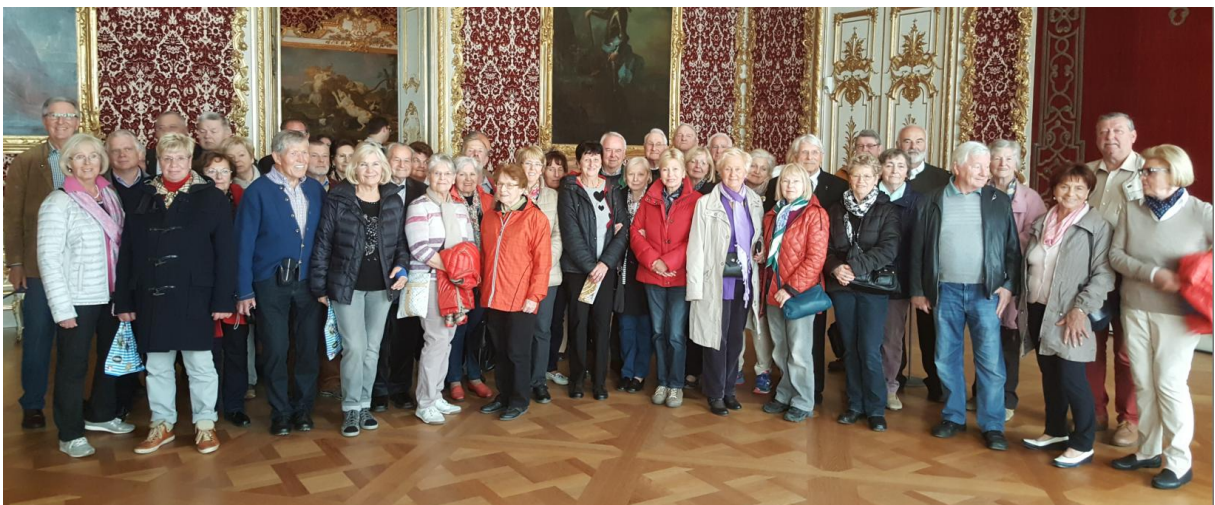
Die CSU- Senioren in einem der "Reichen Zimmer".