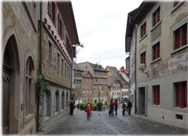
Der Blick von der Oberstadt auf den Stadtplatz mit dem Brunnen. Rechts befindet sich das Bürgerasyl, dessen Ursprünge als Klosterspital im 13. Jahrhundert liegen. Im Inneren sind einige Räume liebevoll restauriert und zeigen anschaulich das Leben der historischen Bewohner (Bild unten).

Rheinbrücke, die Jahrhunderte lang eine strategische Bedeutung hatte. 1267 wird die Stadt erstmals urkundlich erwähnt. Viele mittelalterliche Bauten mit bemalten Häuserfassaden und Fachwerkhäuser mit Erkern prägen das heutige Bild.