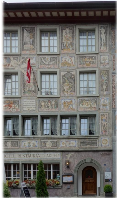
Die Fassadenmalerei am Haus "Weisser Adler" stammt aus den Jahren 1520/1525 und gilt als die älteste erhaltene in der Schweiz

Nachdem sich die Senioren mit Kaffee und Kuchen gestärkt hatten, wurde die letzte Etappe zum Hotel in Singen am Hohentwiel bewältigt, das nur noch eine gute halbe Stunde entfernt war.