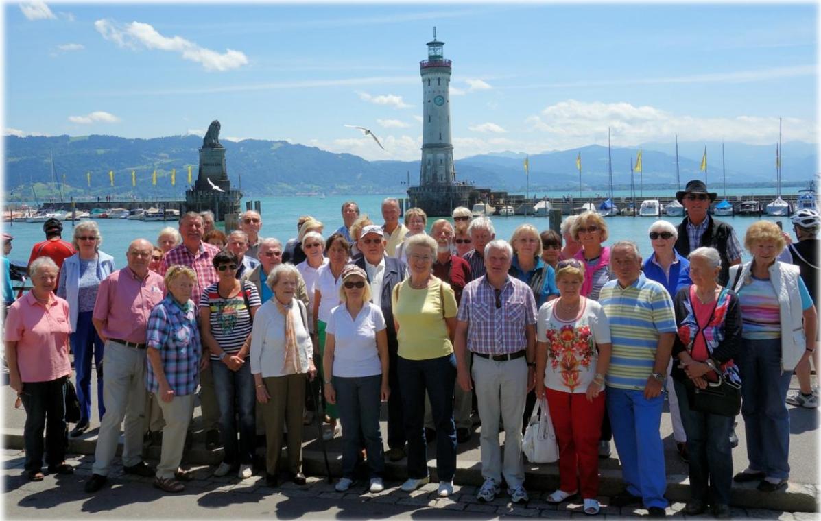
Die Teilnehmer der Fahrt vor der Hafeneinfahrt mit dem bayrischen Löwen und dem Leuchtturm (der Einzige in ganz Bayern)

Beeindruckt vom hohen Technikstand der Zeppelin- Ära stiegen die CSU- Senioren in den Bus, um in der historischen Altstadt von Lindau, dem letzten Reiseziel, das späte Mittagessen einzunehmen und die "Freizeit" in der Sonne zu genießen.