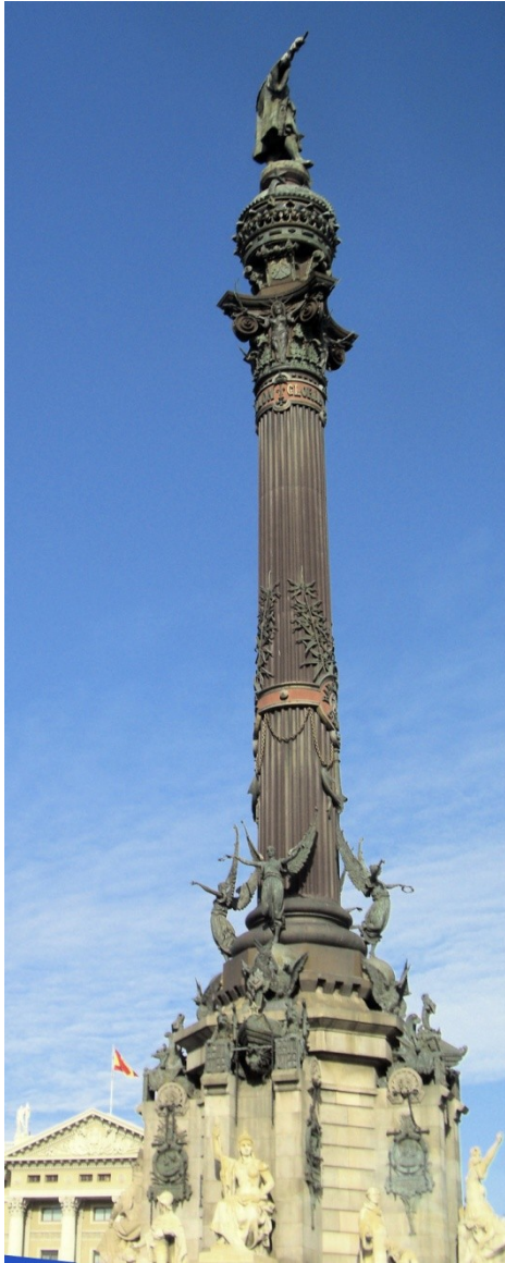
Das Kolumbusdenkmal am Hafen. Ein Aufzug führt im Inneren der Säule auf 60 m Höhe