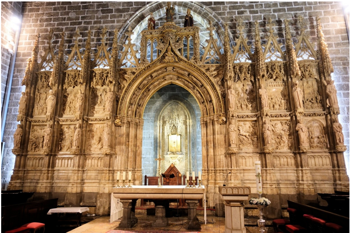
In einer Seitenkapelle der Kathedrale befindet sich der Heilige Kelch, der nach der Überlieferung der Kelch des letzten Abendmahles sein soll.