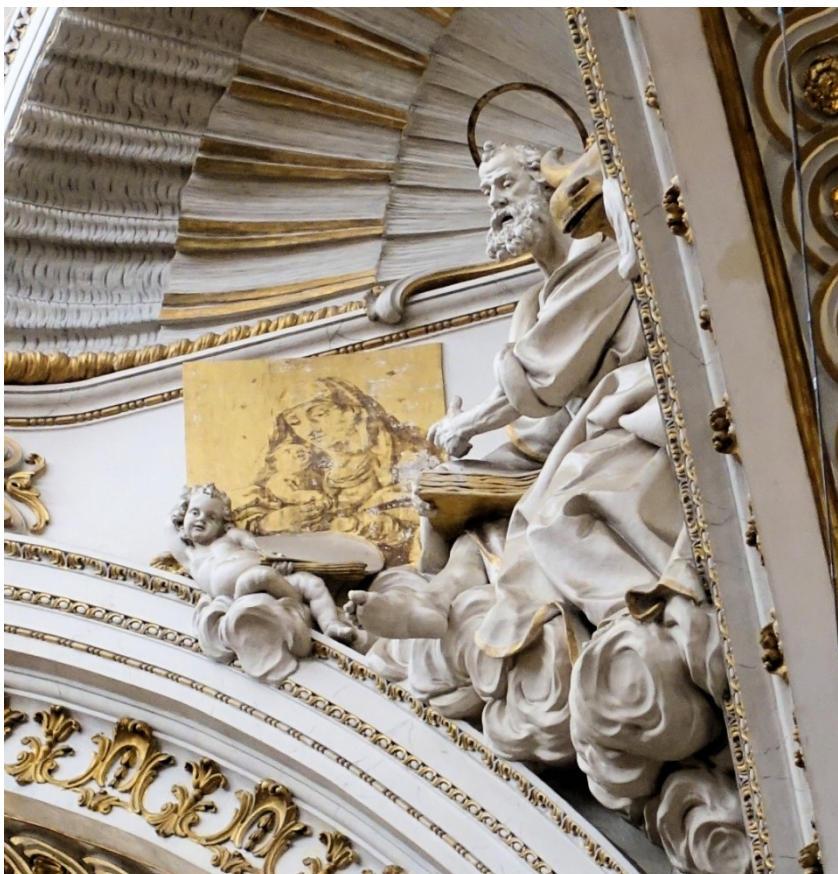
Der Evangelist Lukas (mit dem Stier) hält eine Zeichnung der Gottesmutter mit Jesuskind. Der offizielle Name der Kirche ist Catedral de Santa María de Valencia