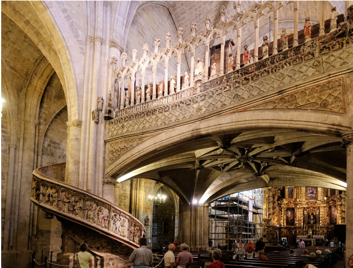
Zentrale Empore mit Wendeltreppe