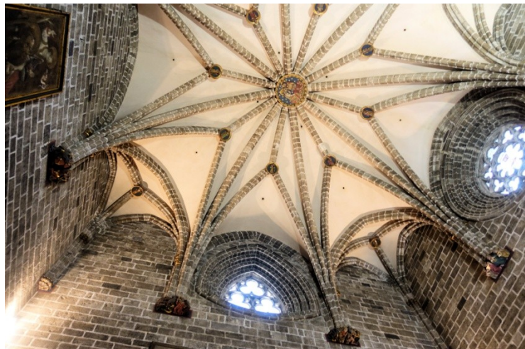
Rechts: Die Decke der Kapelle des Heiligen Kelches

Angeblich soll der Apostel Petrus diesen Kelch nach Rom gebracht haben. Während der Christenverfolgung kam er durch den hl. Laurentius in dessen Heimatland nach Spanien. Seit 1437 ist die Verwahrung des Kelches in Valencia bezeugt. Der ursprüngliche Teil des Kelches ist eine alexandrinische Achatschale aus der Zeit zwischen 100 und 50 v. Chr.. Im Mittelalter wurde diese mit einer Fußschale aus Onyx mit Perlen, Rubinen und Smaragden verziert und einem zweihenkeligen Mittelstück aus ziselierendem Gold zu einer prunkvollen Einheit zusammen gefügt.