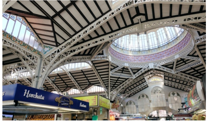
Die filigrane Deckenkonstruktion

Am nächsten Tag war Valencia, die Hauptstadt der Comunidad Valenciana (entspricht etwa einem deutschen Bundesland), das Besuchsziel. Der Mercat central, die Markthalle, ein prächtiges Jugendstilgebäude hat in über 950 Verkaufsständen alles was das Herz bzw. der Magen begehrt.