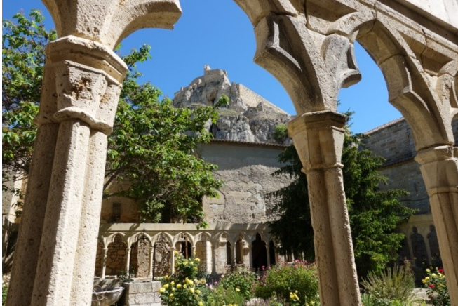
Blick vom Kreuzgang des integrierten, gotischen Franziskanerklosters auf die Burg

Im Gegensatz zu Peniscola hatte diese Burg mit dem zugehörigen Kloster eine militärische Funktion bis 1911 und diente insbesondere im 19. Jh. als Kavallerie- und Infanteriestandort.