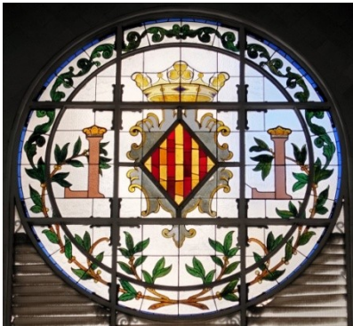
Oben: Rundfenster im klassischen Jugendstil

Rechts: Iberischer Schinken, vom iberischen Schwein, das im Gegensatz zum Hausschwein schwarze Klauen hat. Dieser Schinken ist noch teurer als der bekannte Serrano- Schinken