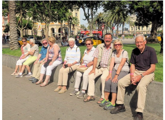
Die bayrische Fraktion in Barcelona

Außer der Casa Mila befindet sich in der Passeig de Gràcia auch der "Häuserblock der Zwietracht", wie das Ensemble modernistischer Gebäude von Casa Lleo Morere, Casa Amatller und Casa Batlló genannt wird. Hier entstand ein Konglomerat architektonischer Tendenzen des frühen 20. Jahrhunderts.