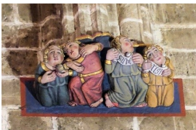
Ausschnitt eines Pfeiler-Lagers