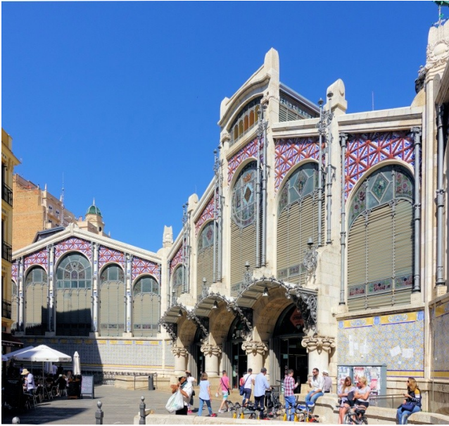
Der Haupteingang der Markthalle

Am nächsten Tag war Valencia, die Hauptstadt der Comunidad Valenciana (entspricht etwa einem deutschen Bundesland), das Besuchsziel. Der Mercat central, die Markthalle, ein prächtiges Jugendstilgebäude hat in über 950 Verkaufsständen alles was das Herz bzw. der Magen begehrt.