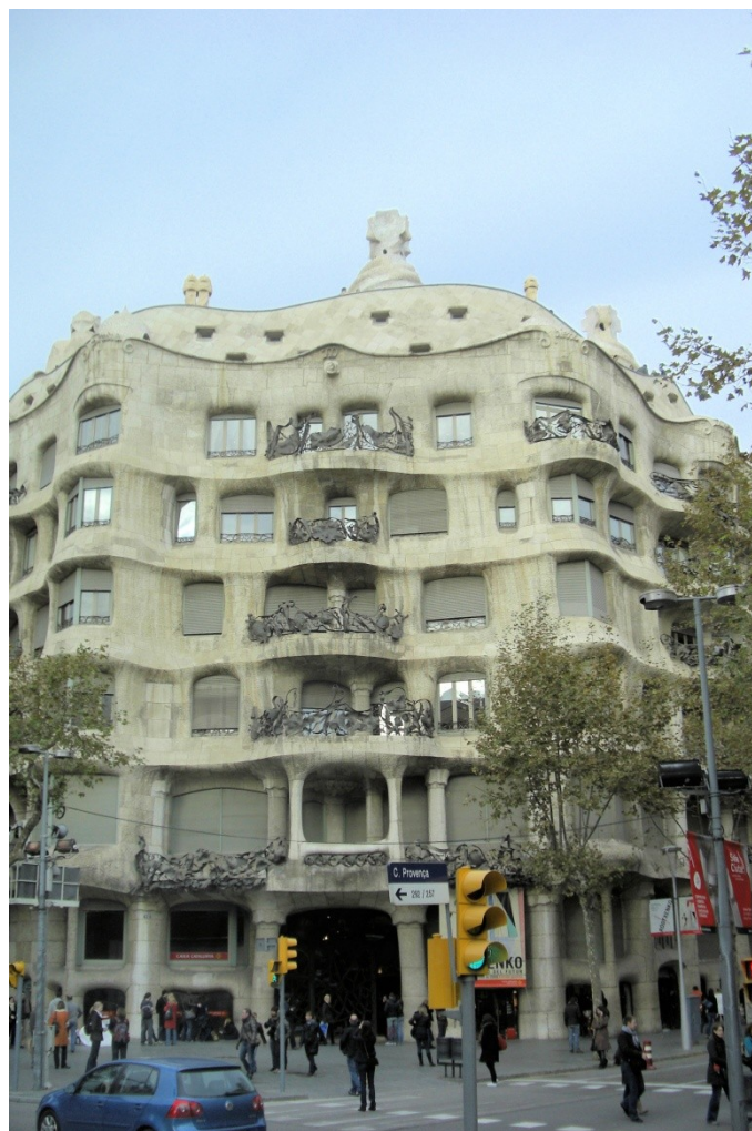
Casa Mila, 1910 fertiggestellt, wegen seiner unregelmäßigen Fassade spöttisch als "Der Steinbruch" bezeichnet, gehört inzwischen zum UNESCO- Weltkulturerbe

Abgesehen von den historischen Bauwerken im gotischen Viertel, wie etwa der Kathedrale und dem Königsplatz waren es die Spuren von Antonio Gaudi, die das Bild von Barcelona prägen. Antoni Gaudi, 1852 als Sohn eines Kupferschmiedes geboren, lernte unmittelbar nach