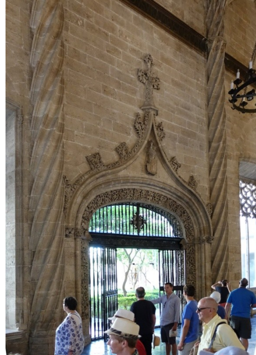
Säulensaal mit Ausgang zum Orangenhof, dem quadratischen Innenhof der Seidenbörse

Heute ist der Bau UNESCO- Weltkulturerbe und insbesondere der prächtige Säulensaal wird für kulturelle Veranstaltungen verwendet.