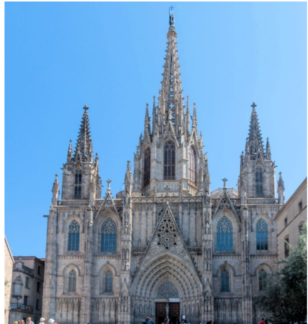
Die gotische Kathedrale aus dem 15. Jh.

Einen ersten Überblick über die Stadt gab es am Montjuic, einem Hügel im Süden der Stadt. Dort befindet sich auch das Olympiastadion und das Poble Espanyol, das "spanische Dorf", das zur Weltausstellung 1929 mit dem Ziel erbaut wurde,