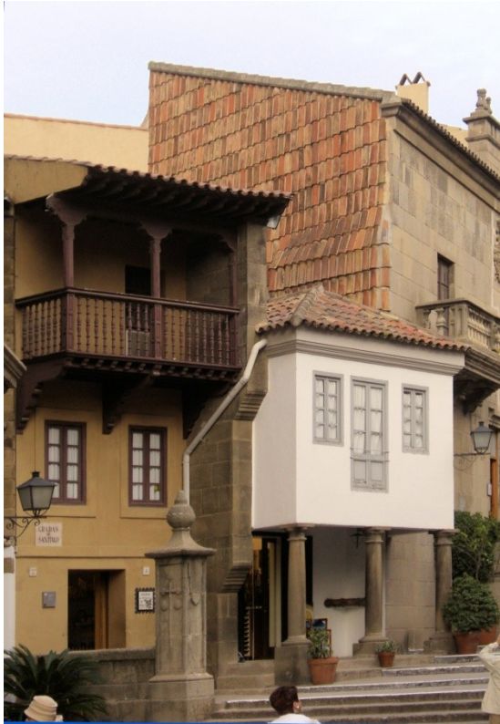
Häuser im Spanischen Dorf jeweils regional- typische spanische Häuser in einem Dorf zu präsentieren.

Der krönende Abschluss des Spanienurlaubs war der Besuch von Barcelona. Ein anstrengender Tag, denn die zweitgrößte Stadt Spaniens war rund 250 km entfernt und bot eine Menge an Sehenswürdigkeiten.