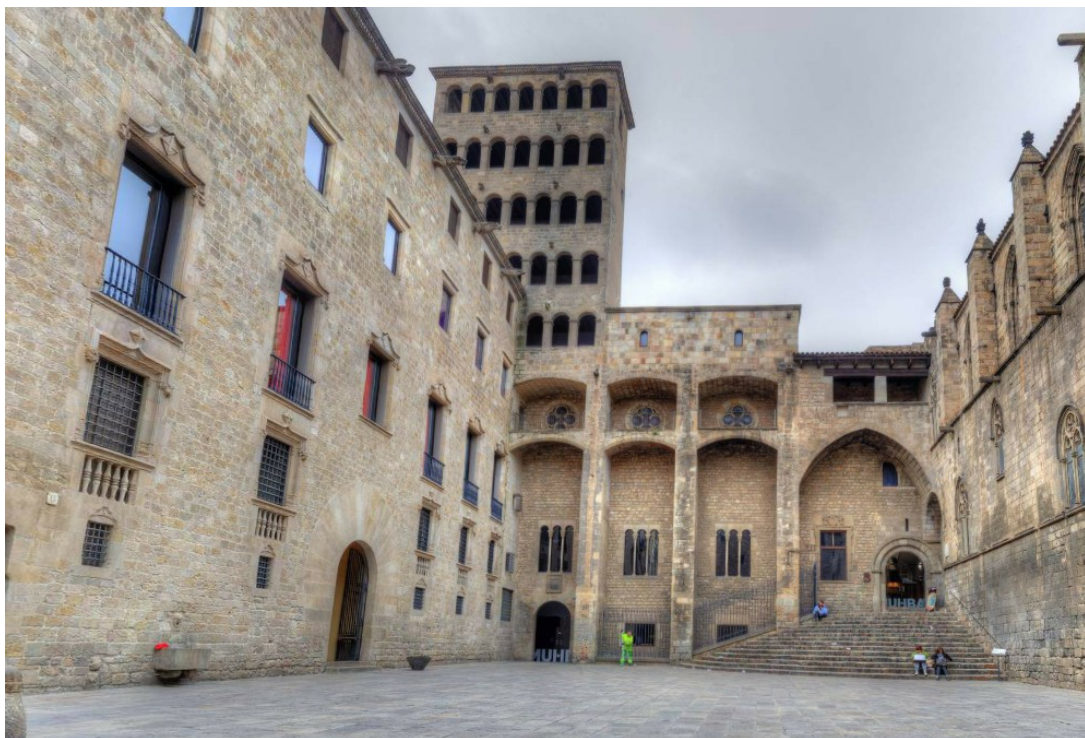
Die Plaza del Rey, der historische Sitz der Grafen von Barcelona und der Könige von Aragonien