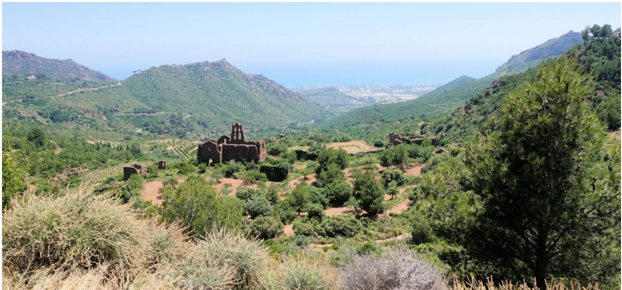
Die Klosterruinen, im Hintergrund Benicàssim und das Meer

Danach geht es auf engen Passstraßen in die "Palmenwüste", einem hügeligen Hochland, 5km von Benicàssim, einem Küstenstädtchen entfernt. Diese "Desierto de las Palmas" ist ein Naturschutzgebiet und zeichnet sich ökologisch durch das Vorkommen von Zwerg- Fächerpalmen aus.