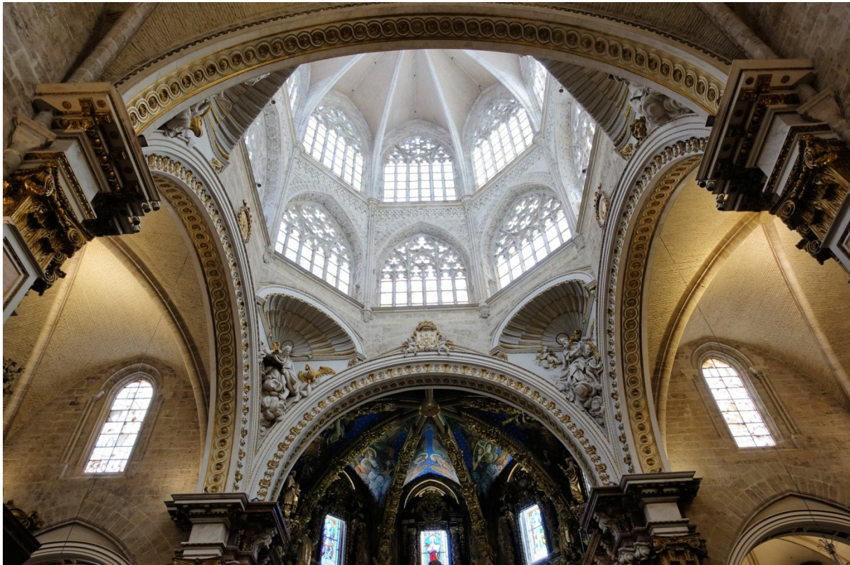
Blick auf Kuppel, Chor und Querschiff der Kathedrale. Dieser Teil wurde während des Spanischen Bürgerkrieges schwer beschädigt, ab 1972 originalgetreu restauriert. In den vier Nischen oberhalb der Kapitelle sind die Figuren der vier Evangelisten.