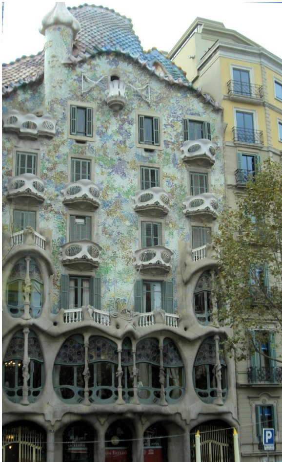
Casa Batlló, das die Legende des hl. Georg wiedergibt. Die glasierten Dachziegel symbolisieren den Schuppenpanzer des Drachens.

Knappe 2 km nördlich befindet sich das wohl berühmteste Bauwerk Barcelonas, die Sagrada Família , an der Gaudi von 1882 an rund vierzig Jahre baute. Die Kirche soll 2026, zum 100. Todestag Gaudis fertiggestellt werden. Gaudi führte ein streng religiöses Leben. Seit 2000 läuft ein Seligsprechungsverfahren in der katholischen Kirche.