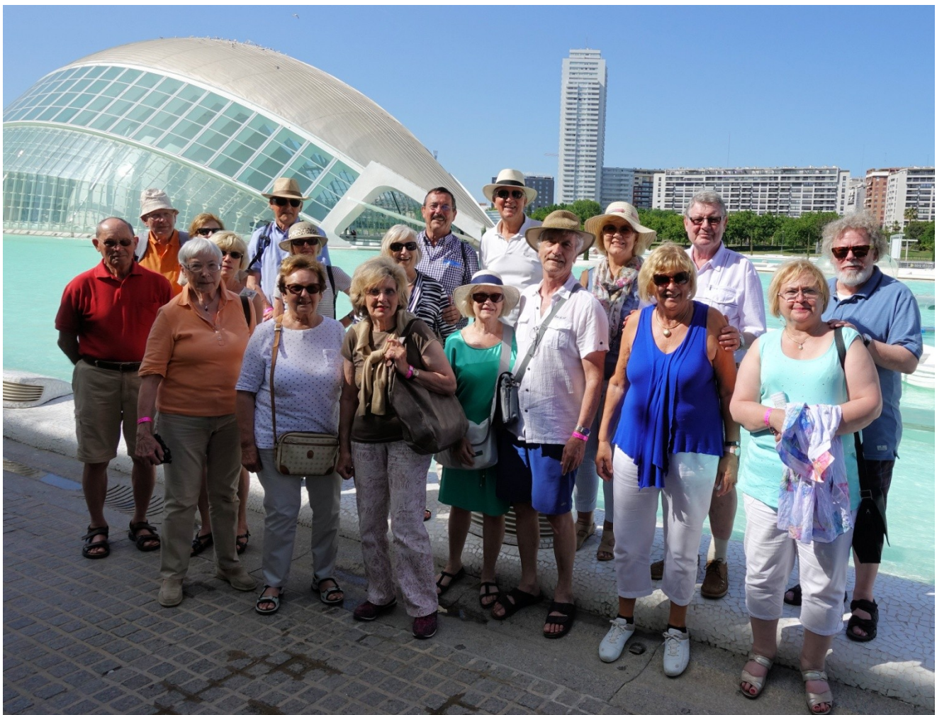
Die bayrische Fraktion vor dem L'Hemisfèric, einem 3D- IMAX- Kino und Planetarium, das als überdimensionales, menschliches Auge konzipiert ist, das "Auge der Weisheit"

Die Elbphilharmonie in Hamburg hat 120000 m 2