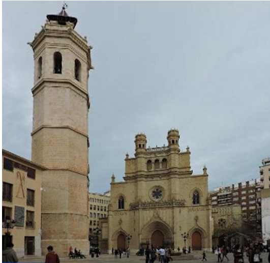
Die Kathedrale Santa Maria und ihr Turm

Schließlich verlassen wir die Stadt um in einer umgebauten Riesendiskotheek ein gutes Mittagessen einzunehmen.