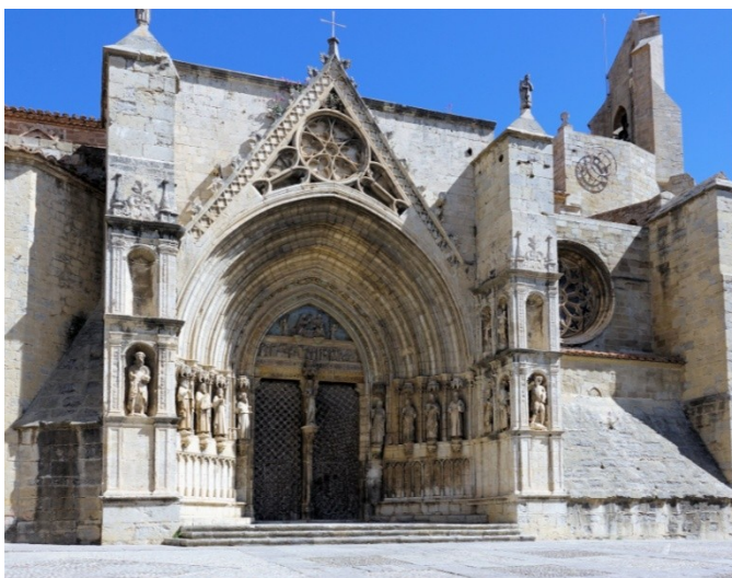
Die Basilika Santa Maria la Mayor mit der Tür der Apostel

Die Kirche stammt aus dem 14. Jh. , der barocke Altar aus dem 17. bis 18. Jahrhundert. Einzigartig ist eine Empore in der Mitte der Kirche, die wiederum gotisch ( 15. Jh.) mit äußerst niedrigen Kreuzrippen ausgeführt wurde, sowie die breite Wendeltreppe, an deren Geländer das Leben Jesu als buntes Relief dargestellt ist.